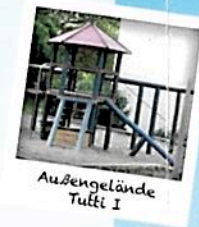
Außengelände Tutti I