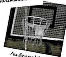
Außengelände Tutti II