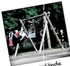
Außengelände Tutti I